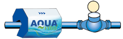
Installation avant le compteur d'eau

Vous avez la possibilité de le fixer sur la canalisation principale soit avant soit après le compteur d'eau. Déterminez la position d' AQUA ® vital . Nettoyez la canalisation. Enlevez les saletés, la rouille en particulier. Retirez la glissière de fermeture et poser l'appareil (dans le sens de la flèche) sur la canalisation principale. Assurez-vous que l'aimant anti calcaire AQUA ® vital soit posé correctement sur le tuyau. Puis insérer de nouveau la glissière de fermeture et tourner les vis de fixation fermement avec les mains.