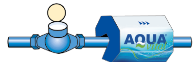
Installation après le compteur